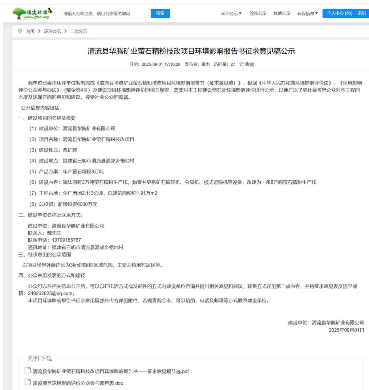
图2 征求意见稿公示（网络平台）