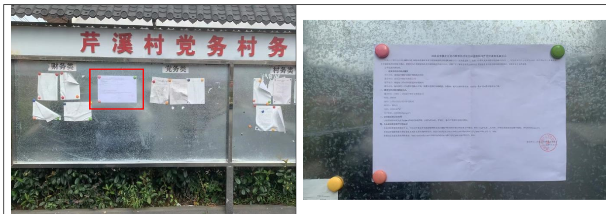
图 4-1 张贴公示（芹溪村公示栏）