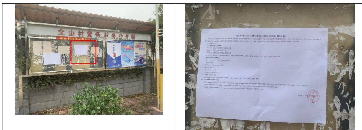
图 4-2 张贴公示（泰山村公示栏）