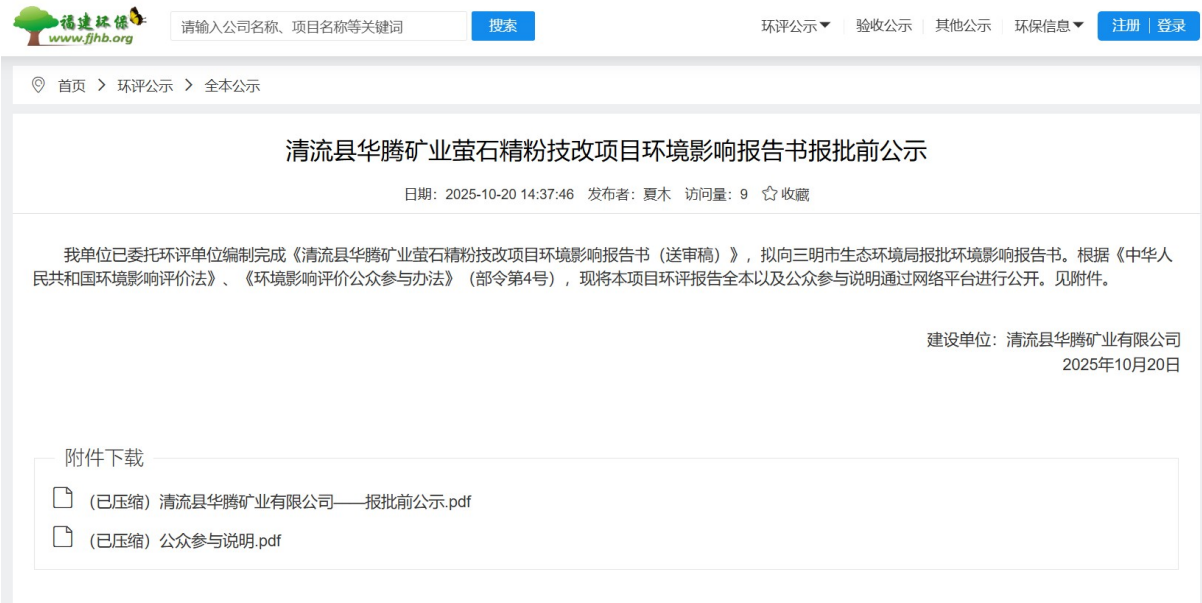
图 6-1 报批前公示

在项目报批前公示期间，建设单位未从电话、传真、信件、电子邮件等途径接到公众相关投诉、意见或建议。