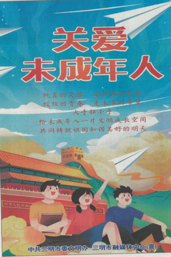
图 3-2 征求意见稿公示(报纸 2025 年 9 月 8 日)

“如果我们的发展没有结果,也会是平淡无奇,但如果我们带着非凡的热情去做不寻常的事,结果或许会完全不同。感谢中国和印尼的合作,给予我们前往中国学习的机会,衷心希望‘村长班’越办越好,如果有机会,我还想再去中国参观学习。”李德福说。