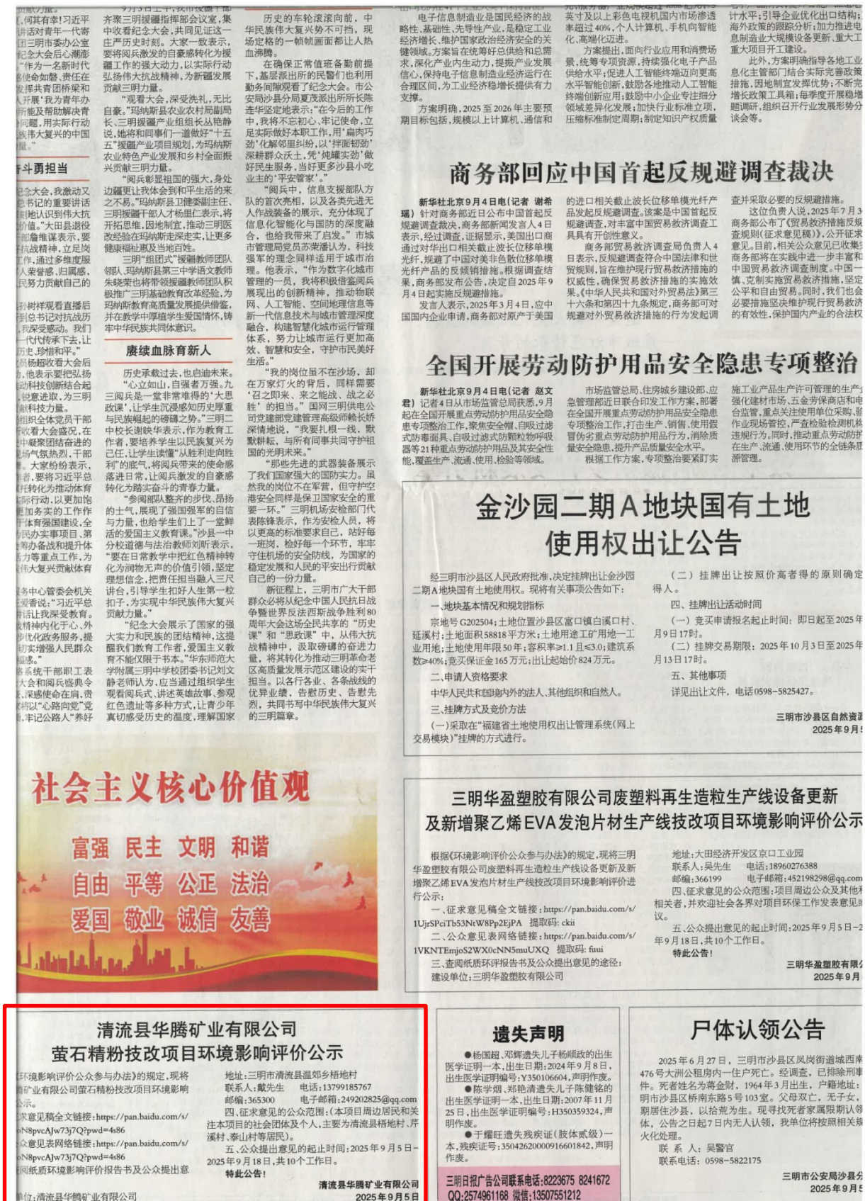
图 3-1 征求意见稿公示（报纸 2025 年 9 月 5 日）